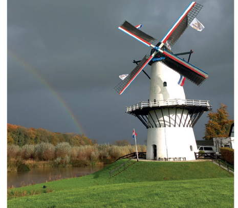
Molen getooid met Nimrod vlaggen

waardeerd. Daar kon de C proef uit de verte -met behulp van kijkers -worden gevolgd.